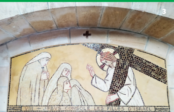
Couverture: Eglise de Brie