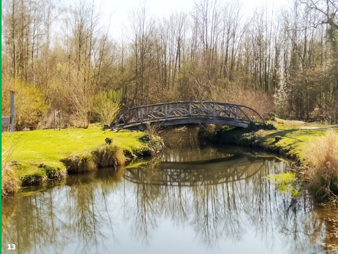
13. parc Delicourt de Ham

Ces visites sont exceptionnellement gratuites !