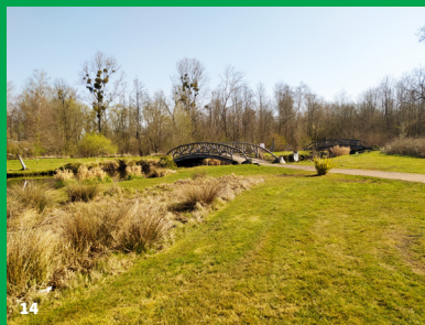
14. Parc Delicourt de Ham