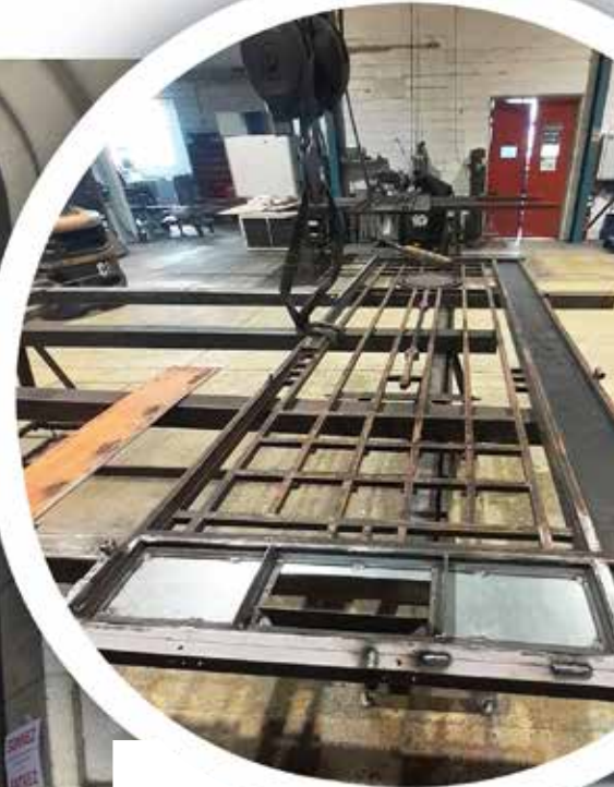
Une étape dans la restauration de la porte au coeur d'un des ateliers de ferronnerie d'art St-Quentinois.

économique Led. En effet, la porte était en mauvais état, les charnières notamment étaient tordues, entraînant un frottement de la porte et des difficultés pour la manipuler correctement. Le processus de restauration a pris un peu plus d'un mois à compter du mois de mars 2024.