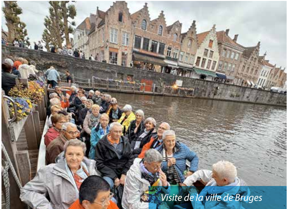
Visite de la ville de Bruges